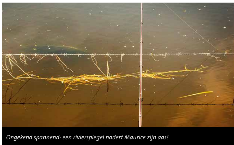
Ongekend spannend: een rivierspiegel nadert Maurice zijn aas!

Op het ondergelopen weiland vist Maurice vandaag uiteraard aanzienlijk lichter: een 50-grams loodje en lichtere hoofdlijn. "Met lieslaarzen of een waadpak kun je de montage heel mooi neerleggen op een plekje waar de karper regelmatig voorbij zwemt. Pas altijd wel goed op waar je loopt: voor je het weet stap je in een diepe greppel. Zorg dat je het bodemverloop vooraf in kaart hebt gebracht door het weiland in droge toestand of bij een lage(re) waterstand te bekijken. Dan weet je wat je te wachten staat." Al weet je dat met het vissen op de rivier – of dat nu om de uiterwaarden of om de hoofdstroom gaat – nooit zeker. "Riviervissen is andere koek dan de plaatselijke parkvijver. Maar als je dan uiteindelijk zo'n prachtige riviervis vangt, is de voldoening ook bijzonder groot", besluit Maurice na een visloze maar zeker geen verloren visdag.