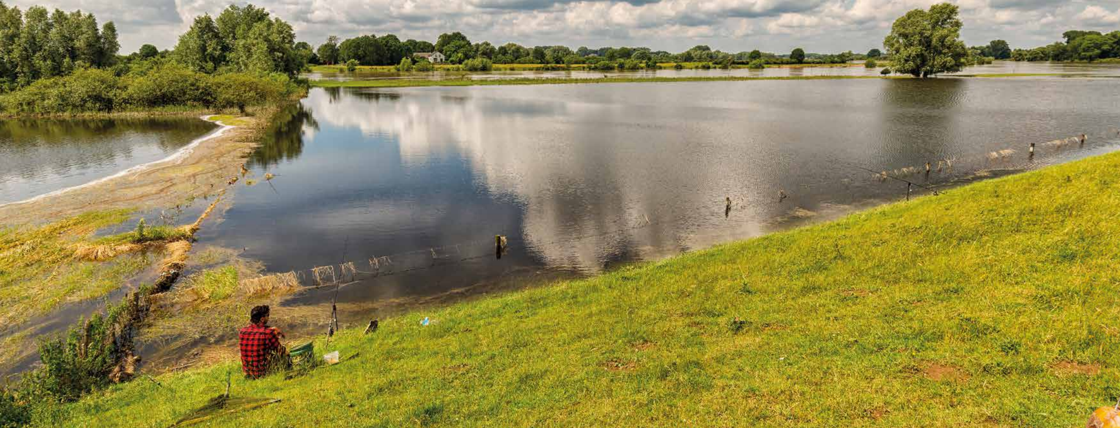
Ondergelopen weilanden vormen door de gedekte tafel die ze er aantreffen ware trekpleisters voor de rivierkarpers.

vis aan, dan zijn twee hengels meer dan zat. Vaak vis ik zelfs met één hengel, soms ook struinend c.q. stalkend. Alles draait om óp de vis vissen. En snel verkassen indien de situatie daar om vraagt.”