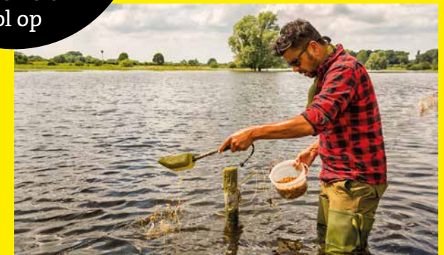
Nadat de hengels in liggen, gaat er nog een schepje particles en boilies te water bij het aas.