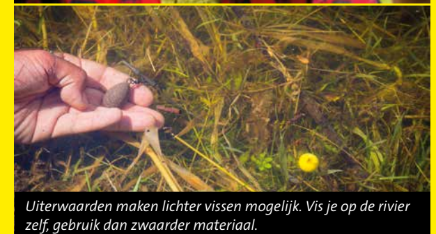
Uiterwaarden maken lichter vissen mogelijk. Vis je op de rivier zelf, gebruik dan zwaarder materiaal.