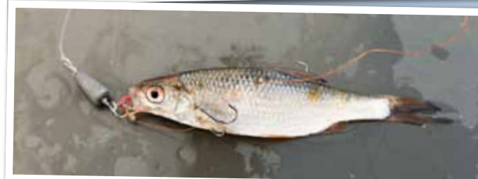
De Drachkovitch takel is geschikt om werpend te vissen met een aasvis.

vrijwel onzichtbare fluorocarbon onderlijn...” Thom stopt abrupt met praten, want uit het niets loopt ineens zijn pen weg. Die komt vervolgens