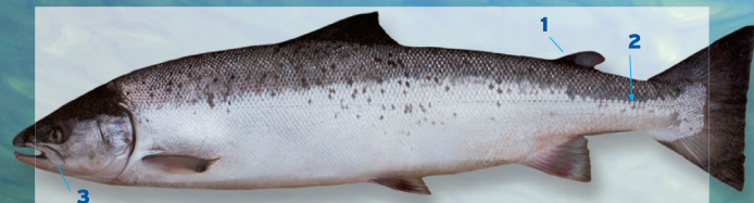
Atlantische zalm* Salmo salar Lengte tot ca. 150 cm

Herkenning 1 Er is een vetvin aanwezig. 2 Tussen de achterkant van de vetvin en de zijlijn liggen, geteld in de richting van de aangegeven pijl, 10-13 rijen schubben (de schub op de zijlijn niet meegeteld). 3 De bek loopt door tot onder het oog.