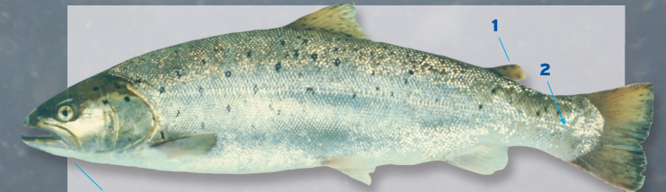
Zeeforel Salmo trutta trutta Lengte tot ca. 140 cm

Herkenning 1 Heeft een vetvin. 2 Tussen de achterkant van de vetvin en de zijlijn liggen, geteld in de richting van de aangegeven pijl, 14-17 rijen schubben. 3 De bovenkaak loopt door tot achter het oog. Op het lichaam komen zwarte, min of meer kruisvormige vlekjes voor. De zeeforel is de trekkende vorm van de forel. Kan worden verward met de zalm.