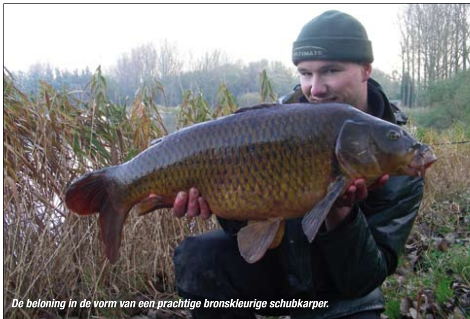
De beloning in de vorm van een prachtige bronskleurige schubkarper.

De in dit artikel genoemde winterstekken zijn hotspots omdat ze de karper er allereerst veiligheid bieden. De vis hoeft er in de regel niet te vluchten voor gevaar en verspilt geen energie. Ook bieden ze bescherming tegen weersinvloeden als een harde ijskoude wind en regen of hagel die het water doen afkoelen. Bovendien blijft warme lucht rondom bruggen en duikers 's avonds langer hangen en geeft het beton/steen ook warmte af. Vergelijk het maar met wanneer je 's avonds laat door een (fiets)tunnel rijdt en je weet wat ik bedoel. Verder staat er altijd een lichte stroming die warmer bodemwater in contact brengt met het oppervlaktewater waardoor ijsgroei minder kans heeft. En last but not least kan de karper er altijd wat te eten vinden in de vorm van driehoeksmosseltjes, vlokreeftjes en slakjes die zich graag vasthechten op brugpilaren of aan de betonnen zijwand van een duiker.