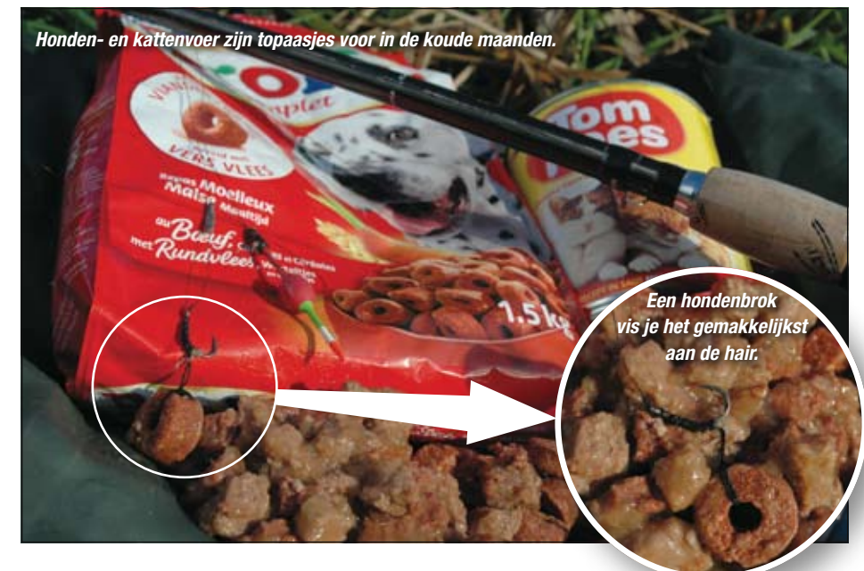
Honden- en kattenvoer zijn topaasjes voor in de koude maanden.

Vis ook nog even door in het donker. Op verschillende slotenstelsels hebben mijn vismaten en ik vaak gemerkt dat de karper tijdens de eerste donkere uurtjes actiever wordt en op aastocht gaat. We vermoeden dat de karper doorgaans pas tegen de avond op stap gaat omdat het dan rustiger wordt langs de waterkant en ze zich in het heldere winterwater toch veiliger voelen wanneer het buiten donker is. Een mooi voorbeeld hiervan hebben mijn vismaat en ik gezien op twee totaal verschillende stelsels die beide door middel van een hele lange duiker onder de snelweg door lopen. Bij daglicht zien we hier geen enkel teken van leven. Zodra de schemering intreedt, schuiven in het glasheldere water al snel de eerste donkere karperschimmen zeer langzaam voorbij in het licht van de knaloranje lantaarnpalen. Een fascinerend schouwspel.