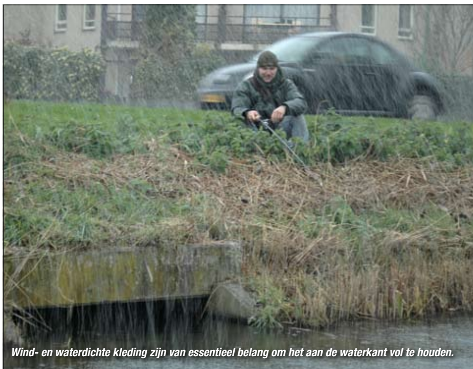
Wind- en waterdichte kleding zijn van essentieel belang om het aan de waterkant vol te houden.

ook met allerlei spul uit blik als zoete maïs, kikkererwten, kapucijners, black eyed beans, bruine en witte bonen kun je verrassend goed vangen. Vergeet ook aassoorten zoals leverworst, kookworst, kaas, deegballen van diverse samenstelling en pellets niet. Honden- en kattenvoer staan ook hoog op de favorietenlijst van mij en mijn vismaten. Vooral Frolic en zachte blokjes Tom Poes kattenvoer uit blik (rond met hart) hebben onze voorkeur. Deze karperlokkers van formaat zijn enorm makkelijk in gebruik en hebben allebei nog een groot voordeel: de hondenbrokken vallen bij een lagere watertemperatuur niet zo snel uit elkaar en het kattenvoer wordt iets minder snel weggewerkt door witvis.