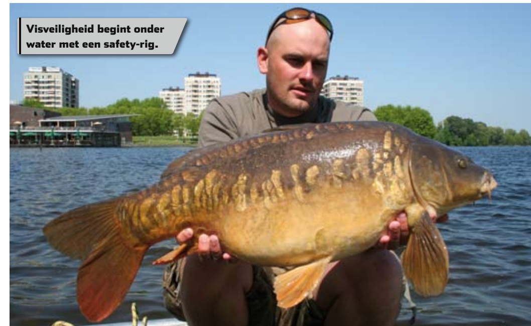
Visveiligheid begint onder water met een safety-rig.

De verschillende typen haken die momenteel op de markt zijn, kun je grofweg onderverdelen in twee typen: langstelige haken (long shanks) en kortstelige haken (short shanks). 'Langstelige haken hebben een sterkere hefboomwerking dan kortstelige