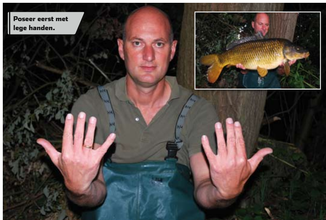
Poseer eerst met lege handen.

Vis ik alleen, dan zet ik aan het begin van de sessie altijd mijn fototoestel klaar. Dit schroef ik vast op een stevige hengelsteun met daarop een verloopnippel (te koop bij de hengelsportzaak). Mijn onthaakmat leg ik op een handige plek neer, waarna ik de steun op ongeveer 1,5 meter afstand daarvan in de grond duw. Vervolgens fotografeer ik mezelf met de zelfontspanner, waarbij ik mijn handen houd zoals op de foto. Even checken of ik niet onthoofd ben en mijn vingers er scherp op staan en zo nodig de afstand aanpassen. Is alles goed ingesteld, dan trek ik een plastic zak over