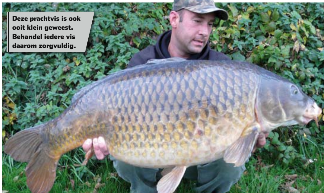
Deze prachtvis is ook ooit klein geweest. Behandel iedere vis daarom zorgvuldig.