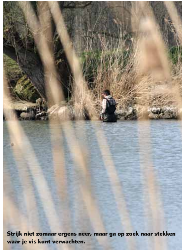
Strijk niet zomaar ergens neer, maar ga op zoek naar stekken waar je vis kunt verwachten.

koude noordoostenwind (winterperiode). Een ander belangrijk element is dat de stekken zich vaak – maar niet altijd! – uit de stroming bevinden.