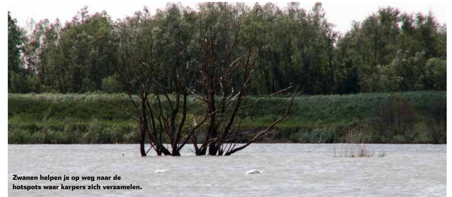
Zwanen helpen je op weg naar de hotspots waar karpers zich verzamelen.

het vissen. Daarbij kies ik voor kwaliteitsballen in felle kleuren die ik per twee aan de hair rijg. Een zinkende in combinatie met een pop-up, zodat het aas ietwat gaat zweven. De dag nadat ik heb gevoerd vis ik het klokje rond, waarbij ik indien nodig tijdens de sessie bijvoer (per keer gaat er zo'n 2,5 kg boilies doorheen). In het begin viste ik alleen overdag, maar gaandeweg kwam het besef dat een dagsessie in de meeste gevallen gewoon te kort is. Je kunt het natuurlijk treffen en in een sessie van vijf uurtjes meerdere loeiharde runs krijgen. Maar meestal gebeurt dit pas als je een goed beeld hebt gekregen van een bepaalde stek. Daarom blijf ik er dan ook minimaal 24 uur