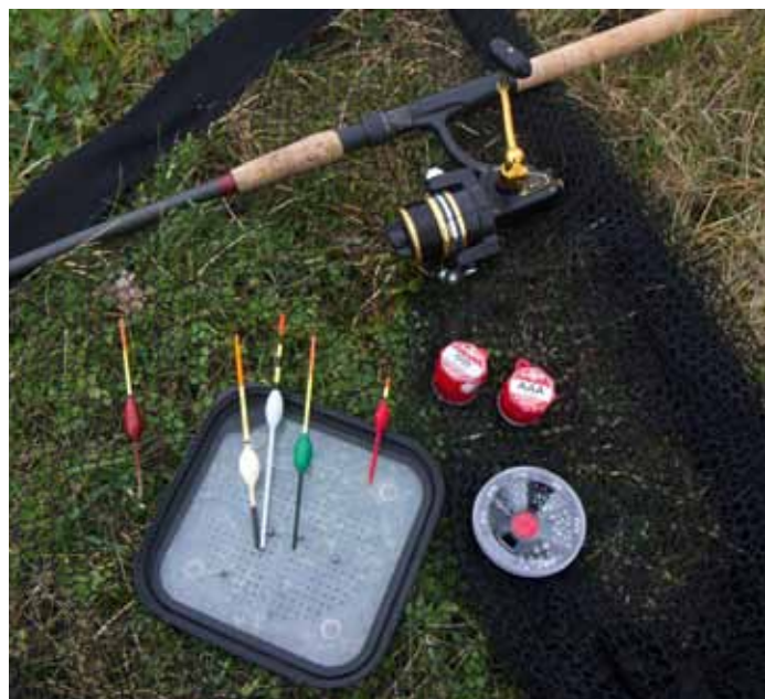
Veel heb je niet nodig om een winterkarper te vangen

top van een van mijn hengels laatst nog tegen het beton toen een vis los schoot." Dure hengels zijn aan hem dan ook niet besteed. Ook wat molens