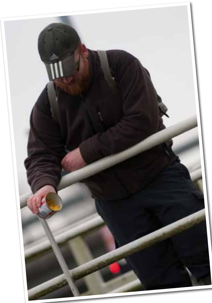
Zo'n tien tot twintig maïskorrels bij je pennetje is zat.

betreft houdt hij het basic. "Tegenwoordig koop je al voor een paar tientjes een molen waar je een hoop plezier van zult hebben."