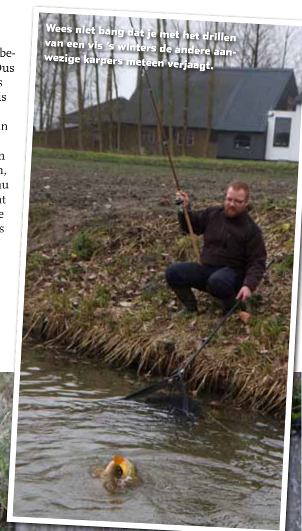
Wees niet bang dat je met het drillen van een vis 's winters de andere aanwezige karpers meteen verjaagt.