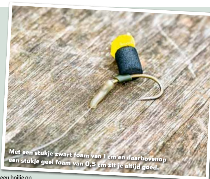
Met een stukje zwart foam van 1 cm en daarbovenop een stukje geel foam van 0,5 cm zit je altijd goed.

Voor wat betreft het aas (de 'zig') hoeft je niet moeilijk te doen: zo'n beetje alles dat blijft drijven vangt wel karpers. Karpers zijn opportunisten en omdat je er niet mee voert, hoeft het enkel de aandacht te trekken. Reggy heeft goede ervaringen met kleine stukjes zwart en geel foam van 1 tot 2 cm groot. Zwart tekent namelijk goed af wanneer een karpers uit de diepte omhoog kijkt. Andersom ziet een karpers aan de oppervlakte het stukje geel foam weer goed, daar dit contrasteert met de donkere diepte. Reggy monteert de stukjes foam net als een boilie op een korte hair: strak tegen de 'curve-shank' haak maatje 10. Denk aan simpel pop-up foam of de drijvende nep-insecten en andere 'zig-bugs' die sommige firma's in hun assortiment hebben.