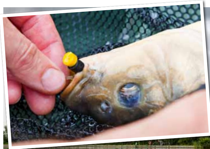
Dril met de hengel omlaag zodat het lood onder water blijft en niet boven water gaat bungelen, wat de kans op lossers verkleint.