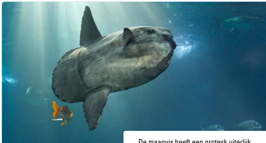
De maanvis heeft een grotesk uiterlijk.

Van Deinse, A.B. & Verhey, C.J. (1964) - Het voorkomen van de Maanvis, Mola mola (L.) in Nederland - De Levende Natuur 67: 63-69