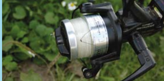
Om telkens op de juiste afstand te werpen knoop je een opvallend stukje nylon als stuitje op de hoofdlijn. Zodra je deze door de ogen hoort gaan rem je af. Zodra het stuitje op de spoel zit weet je dat je korf op de voerplek ligt.

De method feeder is een crossover van klassiek feedervissen en karpervissen met het zelfhaaksysteem. Hieronder laat Gerben Koopmans zien waar hij op let bij deze effectieve techniek.