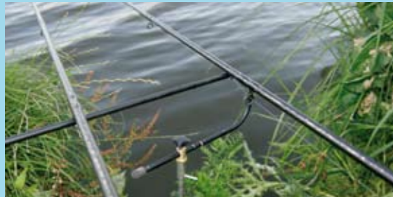
Als je ervoor kiest om met twee hengels te vissen gebruik je een brede steun. Steun je hengels zo af dat de top haaks op de lijn staat. De vis zal zichzelf haken en echt aanslaan is niet nodig.