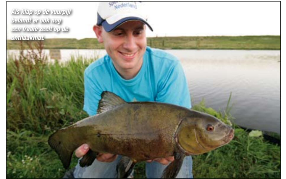
Als klap op de vuurpijl belandt er ook nog een traale zeelt op de onthaakmat.

Ook de tweede vis valt nog niet in de categorie 'Mega', maar is gelukkig wel al iets zwaarder. Een succesvolle strategie is om enkele meters buiten de stek te vissen omdat daar de grotere en dus schuwere brasems zich vaak ophouden. Ik besluit de linkerhengel nog even vol op het voer te laten liggen en de rechter iets buiten de stek te vissen. Beide hengeltoppen laten zo nu en dan een felle tik zien, maar daarop sla je beter niet aan aangezien dit hoogstwaarschijnlijk lijnzwemmers of tikken op de feeder zijn. Als de vis zich heeft gehaakt laat ie dat echt wel merken. Het wachten op een echte wegtrekker