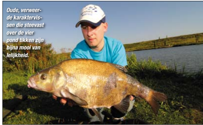
Oude, verweerde karaktervis die steevast over de vier pond tikken zijn bijna mooi van lelijkheid.

is normaal als je al na twee of drie dagen een flinke school zware jongens op je stek hebt liggen. En dan is het tijd om te gaan oogsten. In dit geval blijkt het niet anders. Ik vis op een plas van een paar hectare in een nieuwbouwwijk. Hoewel het water pas zeven jaar oud is zwemt er een mooi bestand aan brasem en in iets mindere mate karper. Vanwege deze laatste krachtpatser kunnen we niet te licht vissen. Je wilt een eventueel gehaakte karper natuurlijk niet verspelen. Als hoofdlijn kies je voor 24/00 tot 26/00 nylon waaraan je de method-feeder direct vastknoopt. De onderlijn is wat mij betreft het belangrijkste onderdeel van deze hele montage omdat dit bepaalt of je de azende vissen wel of niet goed haakt.