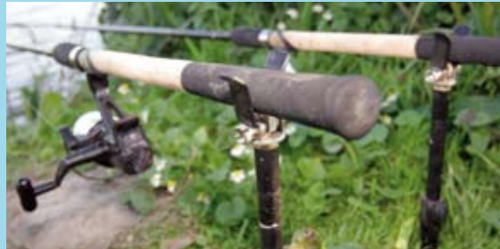
Omdat je elk moment een aanbeet van karper kunt verwachten is het niet onverstandig je hengels goed vast te zetten, bijvoorbeeld met het Safety Lock System van Solar.