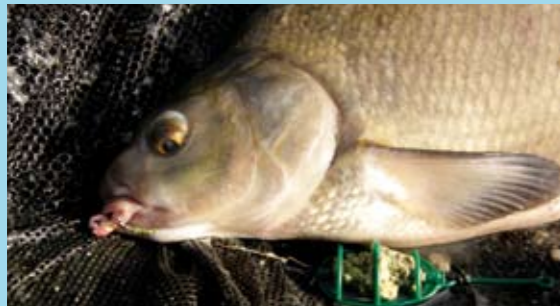
Gebruik een stevige voermix met pellets erin. Dit lost lekker traag op en heeft dus een langdurige attractiewaarde. Hier zie je mooi dat je de onderlijn niet snel te kort maakt. De haak zal dan telkens mooi in de onderlip haken.