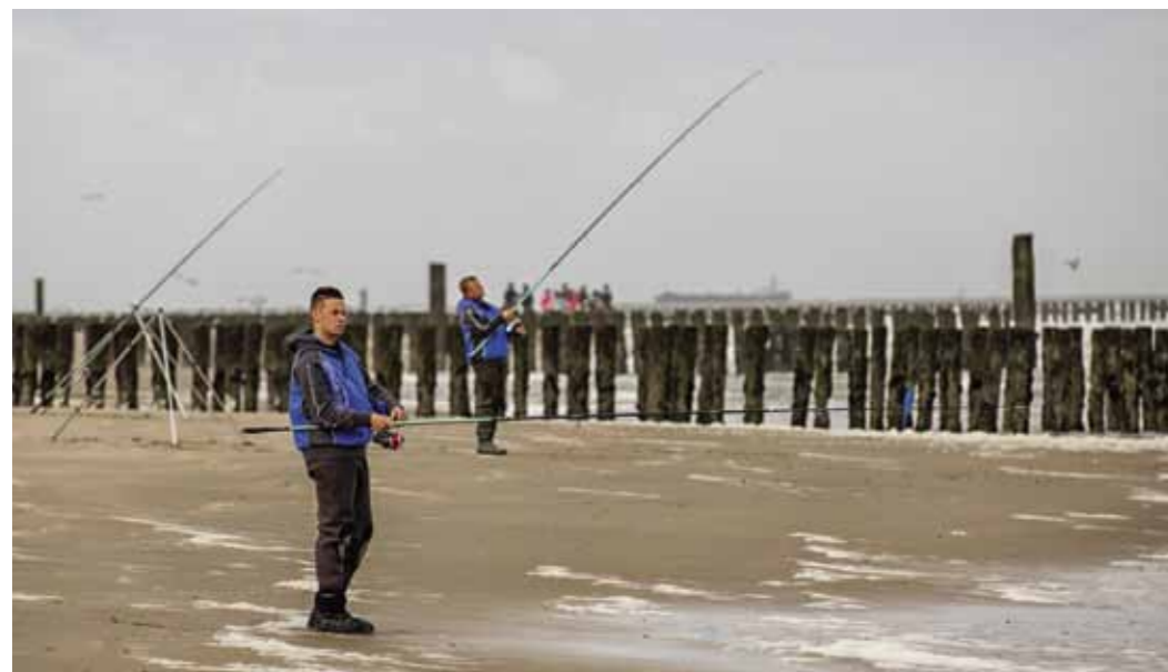
Zeeland offers great angling opportunities on both fresh and saltwater.

The province of Zeeland, in the south-west region of the Netherlands, is a beautiful fishing area. With its many different lakes, canals, channels and creeks, Zeeland has a lot to offer both fresh and saltwater anglers.