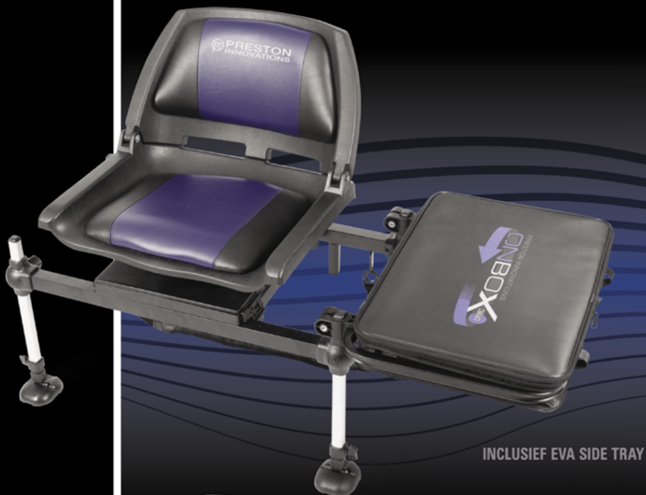
INCLUSIEF EVA SIDE TRAY