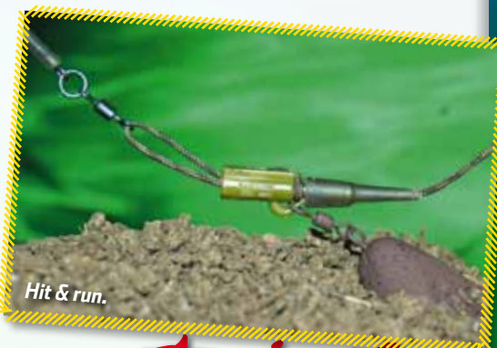
Hit & run.

De 'chod rig' is een zeer visveilig loodstelsel, waar bij de onderlijn dankzij de speciale bevestiging op de leader (voorslag) na lijnbreuk gemakkelijk vrij komt. Bij het veilige Hit & Run systeem (van PB Products) wordt de leader na lijnbreuk als een lus door de speciale loodclip getrokken. Zo raakt de karpers het lood, de leader en hoofdlijn kwijt. Vraag naar deze en andere visveilige systemen in de hengelsportzaak!