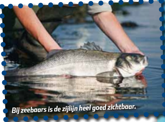
Bij zeebaars is de zijlijn heel goed zichtbaar.

Als je gaat vissen moet je voorzichtig langs de waterkant lopen, anders voelen de vissen jouw voetstappen als trillingen in het water en weten ze dat ze op hun hoede moeten zijn. Ook hard praten zorgt voor trillingen in het water, dus schreeuwen langs de waterkant zal je vangsten niet ten goede komen!