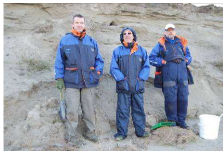
De wedstrijdleiding houdt alles in de gaten