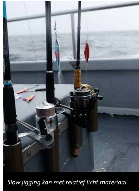
Slow jigging kan met relatief licht materiaal.