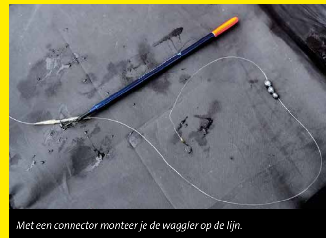
Met een connector monteert je de waggler op de lijn.

Voor het penvissen op zeelt gebruikt Jamie een 3.90 meter lange, 1.75 lbs penhengel en een molen in het 4000-formaat. Zijn uit-rusting bestaat verder slechts uit een net met lange steel, klein onthaakmatje, wat blikken maïs en een etui met wagglers, penne-tjes, haakjes, loodhagels en speciale connectors ('adapters') om de waggler mee op de lijn te monteren.