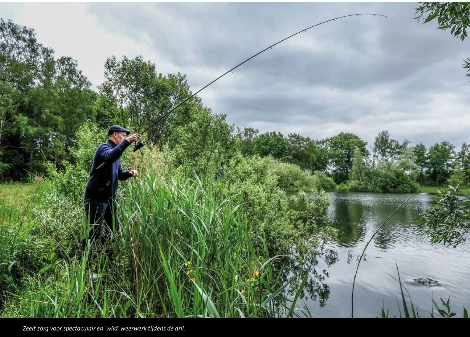
Zeelt zorg voor spectaculair en 'wild' weerwerk tijdens de drill.