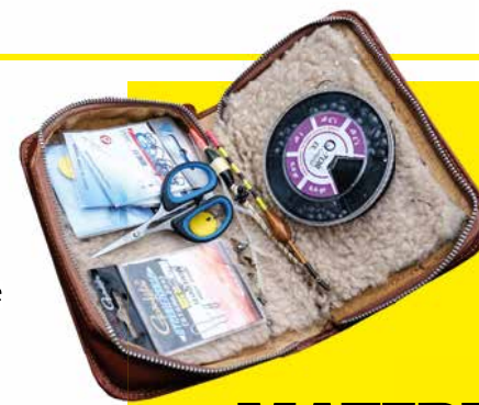
In een etui bewaart Jamie wagglers, pennetjes, haakjes, loodhagels, connectors, schaar-tje en ander klein materiaal.

Bij voerplek nummer 3 valt op dat Jamie zijn montage over de stek heen werpt om vervolgens zoveel lijn bin-nen te draaien dat de dobber bovenop het voer komt te staan. "Zeelten zijn schuwe, voorzichtige vissen. Een plons bovenop je voerplek kan de vis verjagen." Dat zijn aanpak succesvol is, blijkt uit het uurtje dat volgt. Na een tweede (iets grotere) zeelt volgen in rap tempo nummer drie, vier en vijf. Geen uitschieters, al zwemmen hier volgens Jamie vissen tot over de magi-sche zeeltgrens van 60 cm. "Dat zijn echte 'specimens'. Maar zoals gezegd ben ik blij met elke vis. Zelfs met het snoekje dat laatst mijn maïs pakte tijdens het binnen-draaien", besluit de goedlachse Brabander.