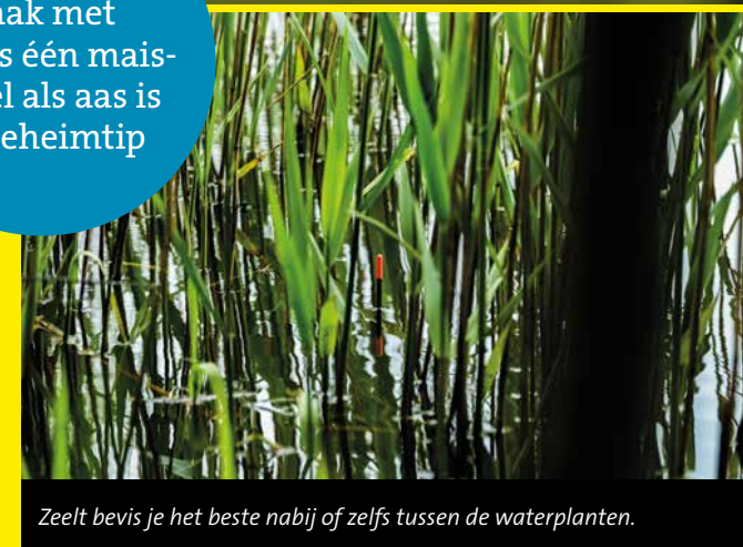
Zeelt bevis je het beste nabij of zelfs tussen de waterplanten.

Een kleine haak met slechts één maïs-korrel als aas is de geheimtip