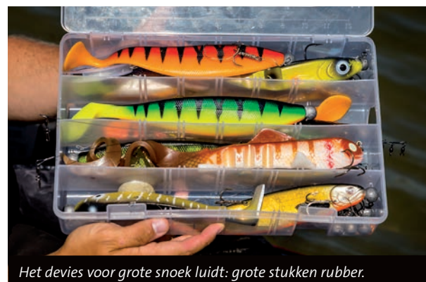
Het devies voor grote snoek luidt: grote stukken rubber.