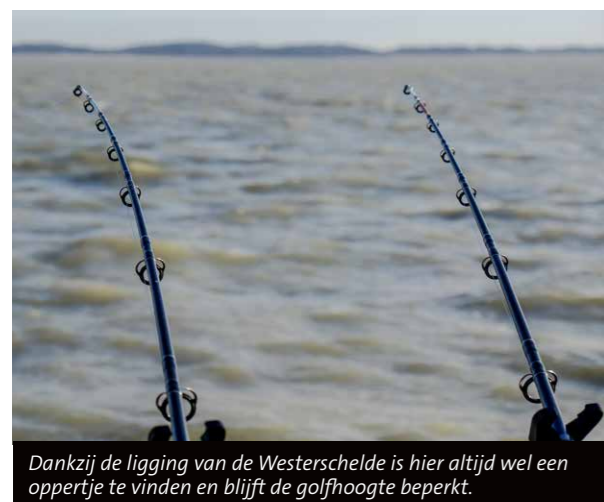
Dankzij de ligging van de Westerschelde is hier altijd wel een oppertje te vinden en blijft de golfhoogte beperkt.