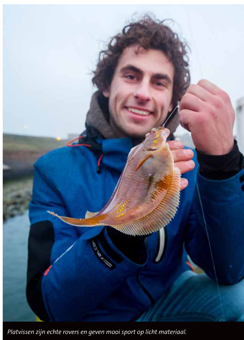
Platvissen zijn echte rovers en geven mooi sport op licht materiaal.