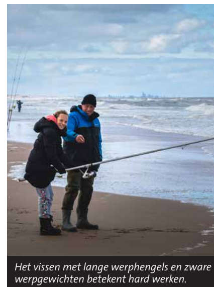
Het vissen met lange werphengels en zware werpgewichten betekent hard werken.

'Deze jeugdviswedstrijd is een mooie, eerste kennismaking met het strandvissen die hopelijk naar meer smaakt'