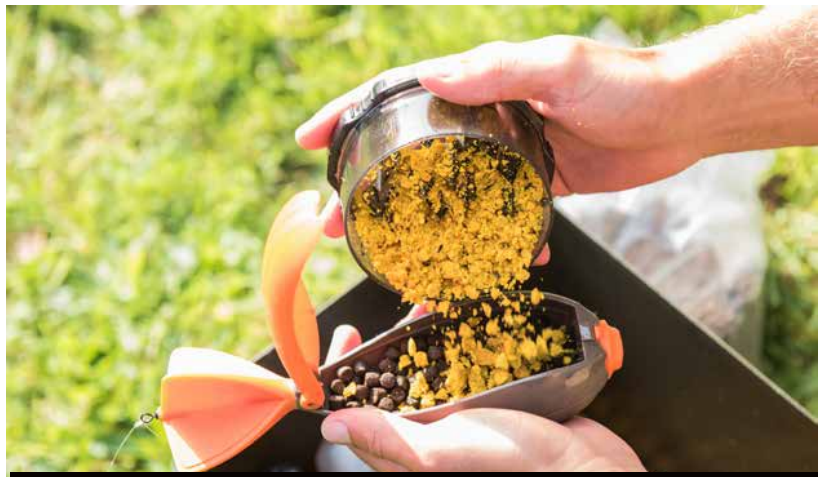
Pellets en gecrushed boilies trekken direct vis aan.