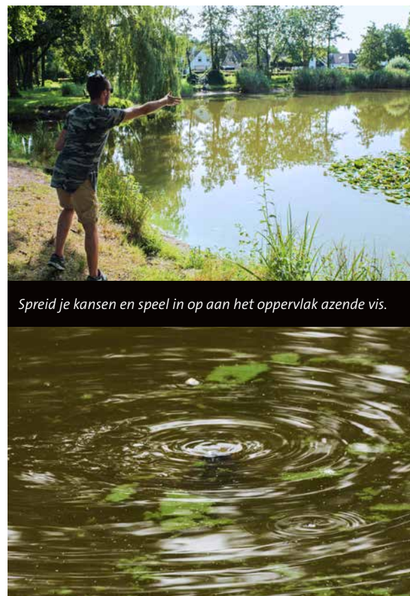
Spread je kansen en speel in op aan het oppervlak azende vis.