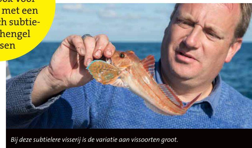
Bij deze subtielere visserij is de variatie aan vissoorten groot.