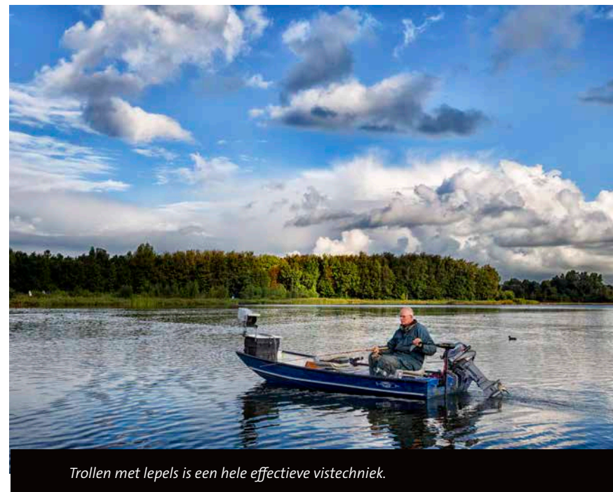
Trollen met lepels is een hele effectieve vistechiek.

Toch is de lepel vooral een perfect stuk kunstaas voor het vissen in de Nederlandse polders. Voor dat type water begon Korver begin jaren '80 zelf lepels te maken. In een tijd dat de schappen van hengelsportzaken nog niet uitpilden van het kunstaas, dook de metaalbewerker zijn schuur in om zelf het perfecte polderaasje te bouwen. “Toen had je alleen dure Rapala pluggen of zware lepels die veel te diep liepen voor onze wateren. Aangezien ik toch al in de metaalbewerking zat, was de