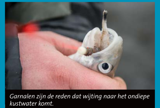
Garnalen zijn de reden dat wijting naar het ondiepe kustwater komt.

De donkere uren zijn favoriet voor de kantvisser. 's Avonds en 's nachts trekt de wijting naar het ondiepe kustwater om zich te goed te doen aan de daar aanwezige garnalen. Die komen in het duister tevoorschijn uit het zand om op zoek te gaan naar voedsel en vormen dan een gemakkelijke prooi voor de wijting. Op ondiepe stekken die overdag weinig vis opleveren, kun je in het donker erg goede vangsten boeken. Heb je diep water binnen werpbereik, dan zijn ook overdag goede resultaten mogelijk. Op de dijken zijn twee uur voor tot twee uur na hoogwater het beste tijdstip, vanaf het strand zijn juist twee uur voor tot twee uur na laagwater favoriet.