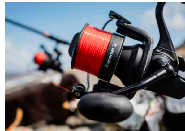
Bot is aan licht materiaal een mooie sportvis.