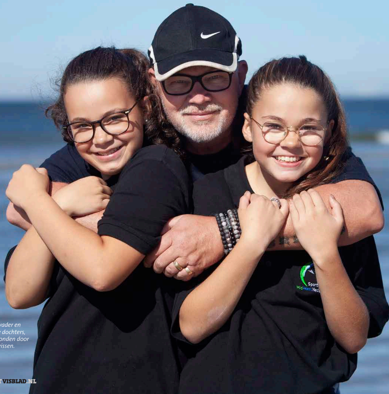
Een vader en twee dochters, verbonden door het vissen.

TEKST: STEVEN VAN DER GAAG > FOTOGRAFIE: MARK VAN DER ZOUW