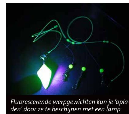
Fluorescerende werpgewichten kun je 'opladen' door ze te beschijnen met een lamp.

aas er niet meer mooi uitziet of wat wankel op de haak zit, vervang ik de tappen of pieren. Je wilt de klandizie toch een mooi bordje serveren”, zegt de horecaman met een knipoog. De verse hap betaalt zich niet veel later uit middels een dikke wijting van 34 centimeter. Die gaat mee voor in de pan. “Het vangen van je eigen maaltijd is een mooie bonus op de tijd voor jezelf die het vissen biedt. Het fileren en bereiden van de vis is deel van de fun en maakt het totaalplaatje extra interessant.”