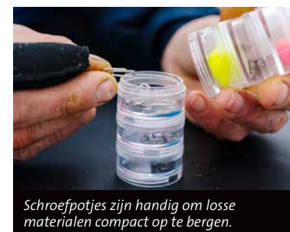
Schroefpotjes zijn handig om losse materialen compact op te bergen.