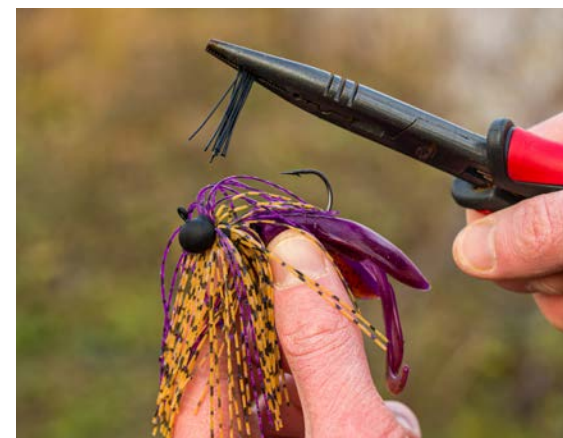
Een creature bait als trailer maakt de skirted jig extra attractief. De weed guard kan in de winter worden verwijderd.

tungsten is gemaakt, voel je daarna wel haarfijn hoe de bodemstructuur en het -verloop is. De zoetwatermosselftjes die we na een worp op de haak zien zitten, hadden we bijvoorbeeld al opgemerkt tijdens het binnenvissen van de skirted jig.