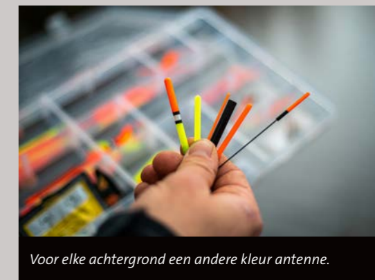
Voor elke achtergrond een andere kleur antenne.

Voor het schuiven vissen met de match heeft Owen een keur aan dobbers (oftewel sliders ), variërend van 12 tot wel 24 gram. Naarmate hij verder weg vist, kiest hij voor zwaardere exemplaren. Ook bij veel wind gebruikt hij een zwaarder model om precies op zijn voerstek te kunnen vissen. De antennes zijn vaak verwisselbaar, zodat de kleur is af te stemmen op de achtergrond of het licht. “Zwart steekt soms bijvoorbeeld beter af tegen een lichte achtergrond”, aldus Owen. “Daarnaast geldt: hoe dunner het model, des te minder windgevoelig de dobber is.”