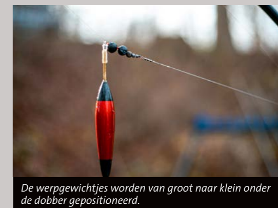
De werpgewichtjes worden van groot naar klein onder de dobber gepositioneerd.

Owen houdt zijn schuivende montage zo eenvoudig mogelijk. Op de nylon hoofdlijn van 18/00 tot 20/00 komen achtereenvolgens een lijnstopper, kraaltje en de dobber – eventueel met een afhoudertje. Daarna volgen de werpgewichtjes van groot naar klein. Het te gebruiken gewicht staat meestal op de dobber vermeld. Zo betekent 20+4 dat je 20 gram aan gewicht nodig hebt, terwijl de dobber zelf al vier gram draagt. Owen knoopt tot slot een klein warteltje aan de lijn, met daaraan de 12/00 tot 18/00 onderlijn van 30 tot 50 cm en de haak (maat 18 tot 10). “Je zal zelf een beetje moeten uitdokteren wat voor jou de juiste samenstelling is”, stelt Owen. “Het belangrijkste is dat je de montage niet snel in de knoop gooit.”