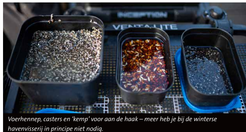
Voerhennep, casters en ‘kemp’ voor aan de haak – meer heb je bij de winterse havenvisserij in principe niet nodig.