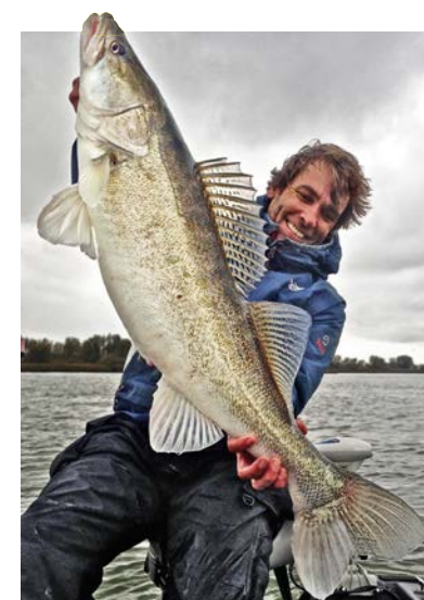
De auteur met een snoekbaars van 98 cm die hij op 4 november 2015 ving.

Een typische, eigen bouw. Vinnen schuren af of splijten. Al deze eigen-schappen maken dat we een grote snoekbaars kunnen herkennen. Tevens kunnen we snoekbaars met 100% zekerheid identificeren aan de hand van de ‘barcode’ die in de stel-kelkam verborgen zit. Deze is voor iedere vis uniek! Aangezien het vlies tussen de stekels transparant is, kun je de barcode aan beide zijden van de vis aflezen – als de stekelkam omhoog staat op het kiekje. Dit biedt de mogelijkheid om vissen heel precies met elkaar te vergelij-ken; ook als ze met de andere flank op de foto zijn gezet.