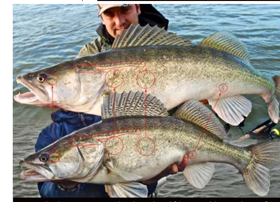
Details die aantonen dat het dezelfde snoekbaars betreft.