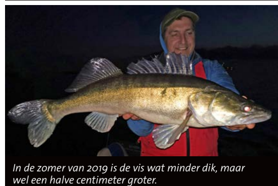
In de zomer van 2019 is de vis wat minder dik, maar wel een halve centimeter groter.