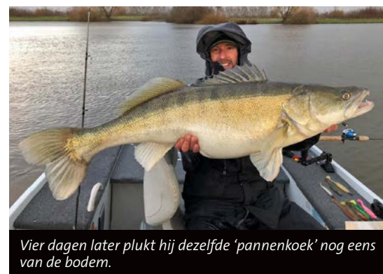
Vier dagen later plukt hij dezelfde 'pannenkoek' nog eens van de bodem.