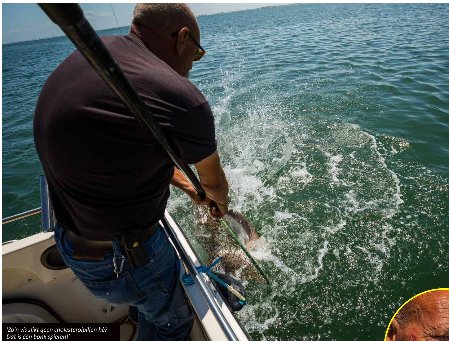
'Zo'n vis slikt geen cholesterolpillen hè? Dat is één bonk spieren!'