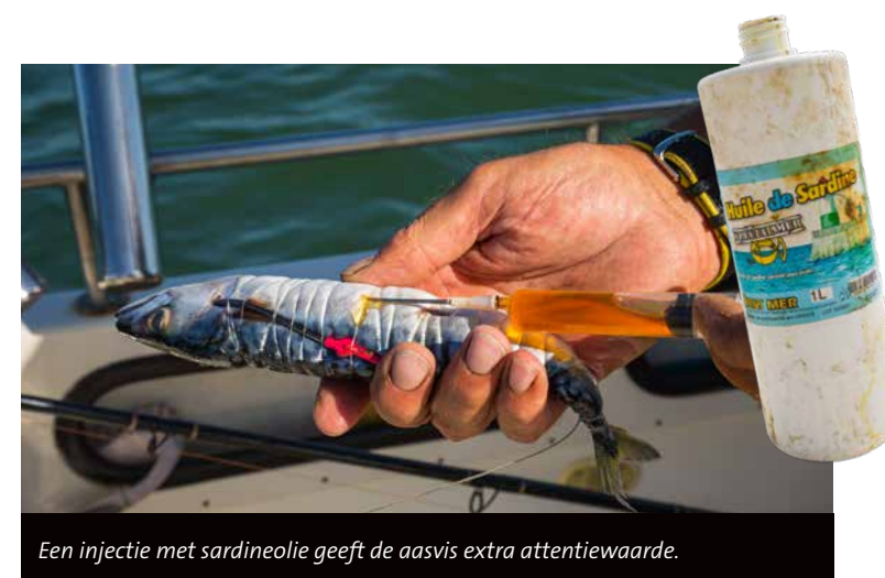
Een injectie met sardineolie geeft de aasvis extra attentiewaarde.