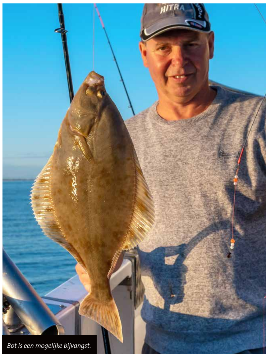
Bot is een mogelijke bijvangst.