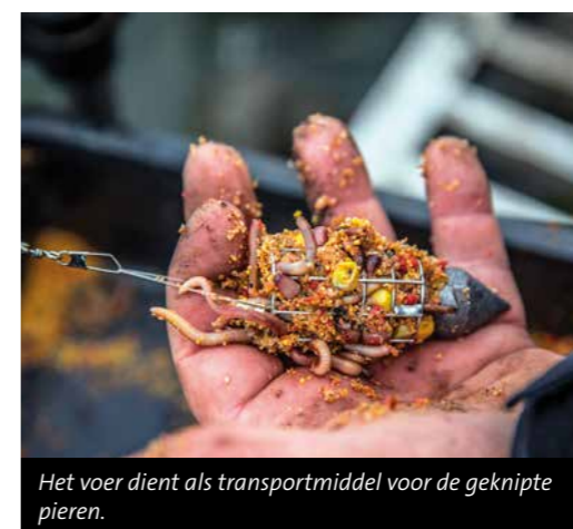
Het voer dient als transportmiddel voor de geknipte pieren.