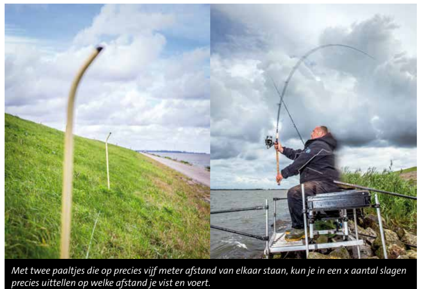
Met twee paaltjes die op precies vijf meter afstand van elkaar staan, kun je in een x aantal slagen precies uittellen op welke afstand je vist en voert.