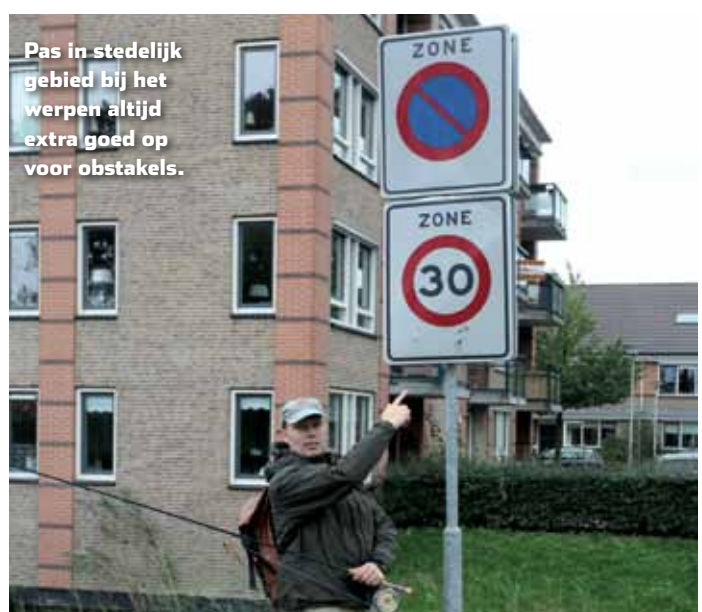
Pas in stedelijk gebied bij het werpen altijd extra goed op voor obstakels.

's Middags vissen we een ander gedeelte van de nieuwbouwwijk af. In het heldere slootwater kun je de streamer prima volgen, wat het geheel natuurlijk extra spannend maakt. Die spanning ontlaadt zich als een snoek zich uit