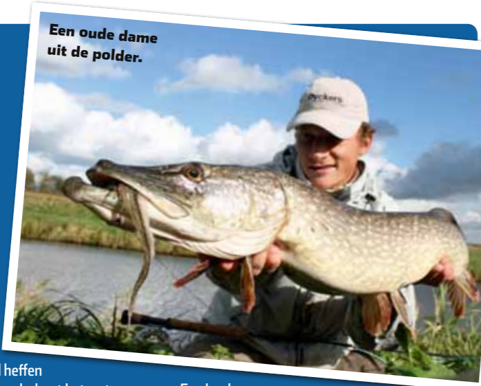
Een oude dame uit de polder.

Eind oktober 2011. Het weer is eigenlijk te mooi om van ideale snoekomstandigheden te kunnen spreken. De drang om op zondagmiddag een paar uurtjes in de polder te gaan struinen is echter groot. Er gewoon even uit en genieten. De laatste tijd is er weinig regen gevallen, waardoor de polderpompen nagenoeg stil staan en het water mooi helder is. Dat geeft vertrouwen. Snel vissen met grote streamers is het devies. Na iedere worp zet ik drie stappen en hop daar gaat de streamer weer. Snel en met felle rukken vis ik hem binnen. Net voordat ik de vliegenlat wil heffen voor een volgende haal naar achteren, explodeert het water voor me. Een beuk en een hevig kromme hengel maken duidelijk dat het om een serieuze poldersnoek gaat. Een kort, maar mooi gevecht volgt. Twee prachtige jumps door de oppervlakte, flink kopschudden en dan is het over. Snel schep ik de snoek met behulp van het net dat ik op mijn rug bij me draag. Binnen! Een wonderschone, oude polderdame. "Das een beste heurrrr", hoor ik achter me. Ik schrik. Zonder dat ik het heb gemerkt, is een oud boertje op de fiets bij me komen staan. "Ja, een mooie, oude dame", antwoord ik. Snel onthaak ik de vis en na een paar plaatjes te hebben gemaakt, zet ik haar terug. "Tot volgend jaar", fluister ik ter afscheid. Daarna zeg ik de boer gedag. Hij gaat verder richting zijn schapen, voor mij is het inmiddels tijd om huiswaarts te keren. Weer een middagje om in te lijsten!