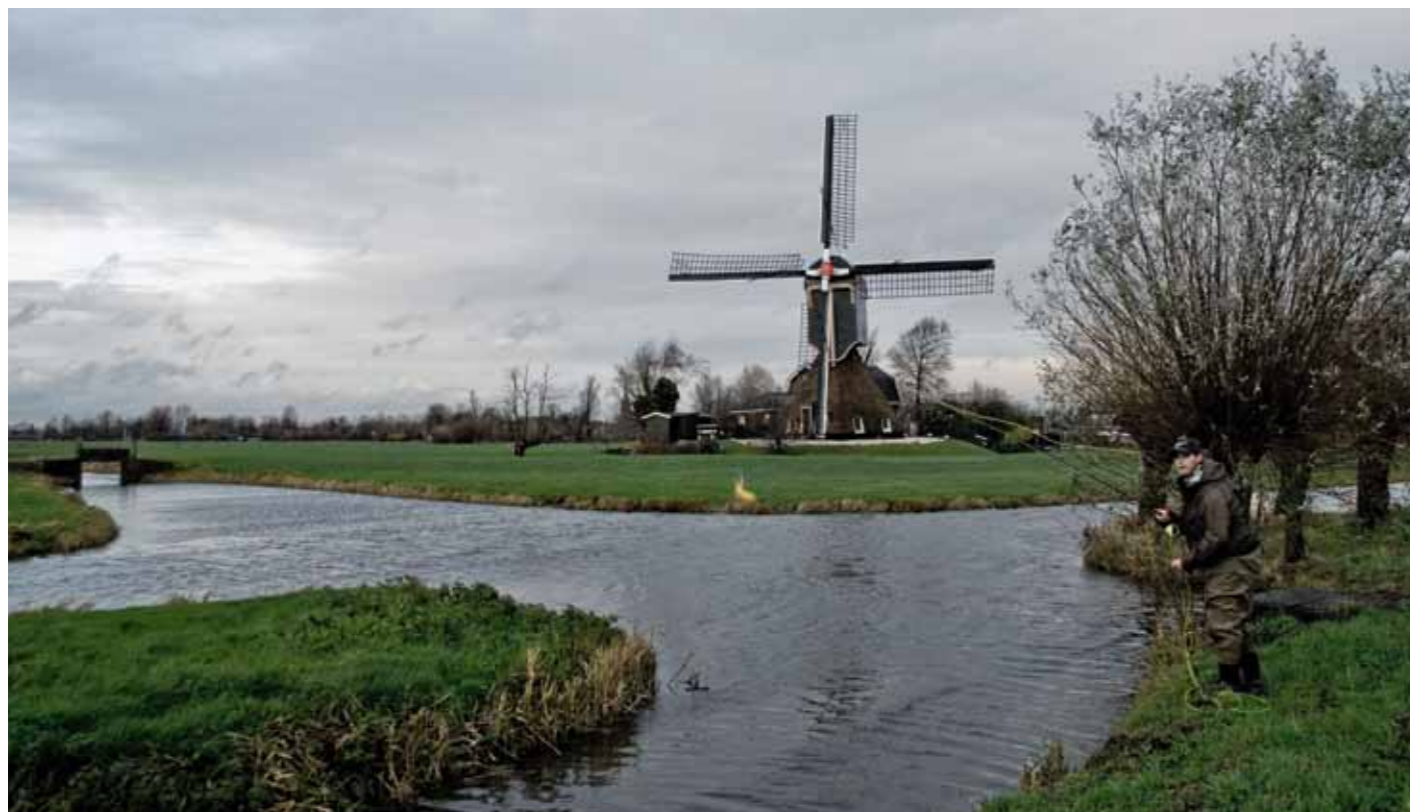
De Nederlandse polders zijn uitstekend vliegvis- en snoekwater.

A l vanaf mijn achtste, nu meer dan 25 jaar geleden, vis ik op snoek. Eerst met zelfgemaakte spinners, later met de bekende redhead pluggen en de laatste twintig jaar vrijwel uitsluitend met de vliegenlat. Het werpen, directe contact