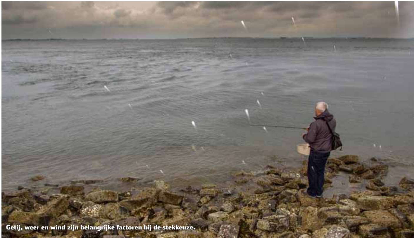
Getij, weer en wind zijn belangrijke factoren bij de stekkeuze.

voorzichtige staartbijter weet te haken.” Voor het wat diepere werk grijpt hij naar vliegen van het type clouser deep minnow, een visimitatie met verzwaarde oogjes die als een jig op en