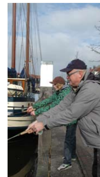
Op de kale kademuur van Elburg is het niet noodzakelijk, maar strip je lijn bij voorkeur met 'achtjes' binnen.