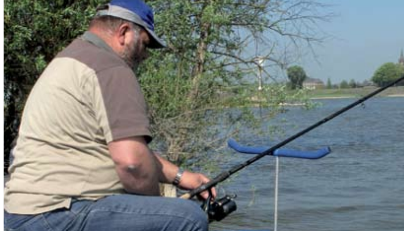
Leun niet achterover, maar trigger de vis door je aas te activeren.

niet meer nodig omdat de vis zichzelf al heeft gehaakt op het gewicht van de korf. Let op: dit geldt alleen voor stromend water. Aanbeten herken je in negen van de tien gevallen aan de hengeltop die terugveert. Dit gebeurt omdat de lijn, die tijdens het vissen vanwege slack en stroming altijd iets onder spanning staat, slap valt.” ◀