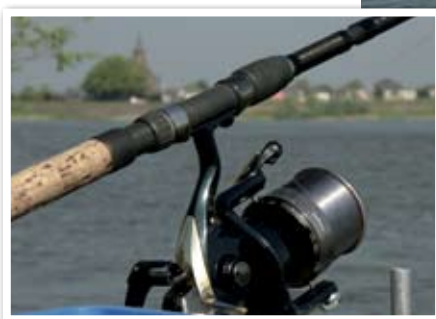
De omstandigheden op de rivier vragen om stevig materiaal.

zware werk aan kan. Hiervoor gebruik ik een Daiwa Emcast-plus 6000. Deze draait per seconde een meter lijn binnen en geeft geen krimp als er een zware korf aanhangt. Stem je materiaal af op het beulswerk aan de rivier.”