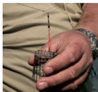
De korf hangt in een lus en werkt als zelfhaaksysteem.

“Met een medium feederhengel die een parabolische actie heeft, kun je korven tot 100 gram wegzetten en bijna overal terecht. Vis ik echter buiten de kribben, vol in de stroming, dan pak ik korven van meer dan 100 gram en kies ik voor een heavy feeder. Bij het feederen op de grote rivieren hoort ook een molen die dit