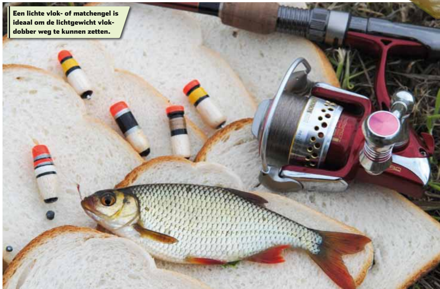
Een lichte vlok- of matchengel is ideaal om de lichtgewicht vlok-dobber weg te kunnen zetten.