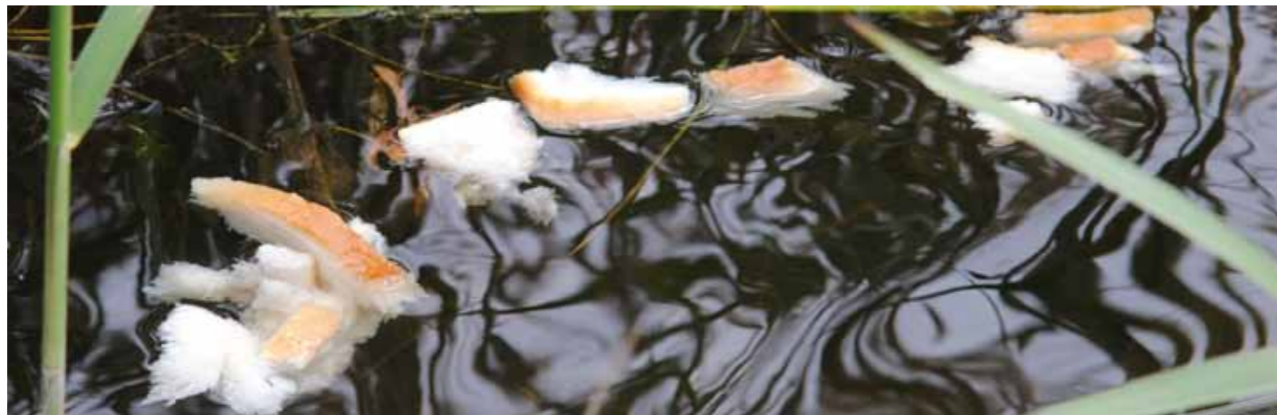
Door wat broodkorsten te strooien, krijg je ruisvoorn vaak al snel aan het azen.

problemen kunt landen. Het monteren van een dunnere onderlijn is overbodig.