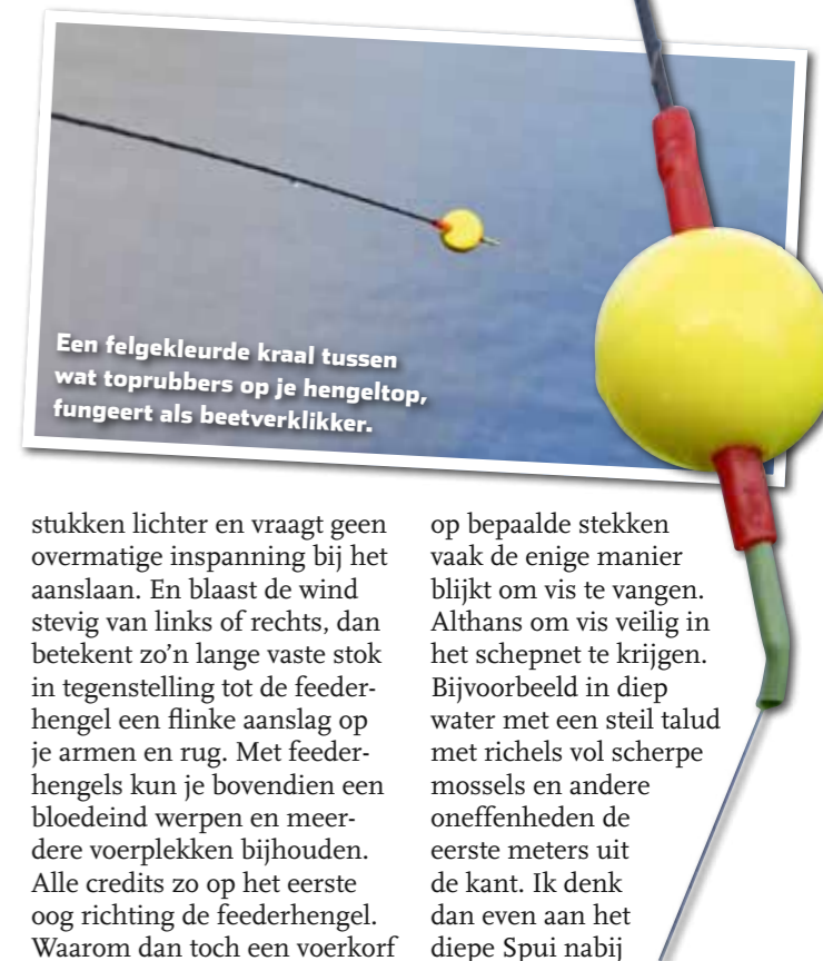
Een felgekleurde kraal tussen wat toprubbers op je hengeltop, fungeert als beetverklikker.

op bepaalde stekken vaak de enige manier blijkt om vis te vangen. Althans om vis veilig in het schepnet te krijgen. Bijvoorbeeld in diep water met een steil talud met richels vol scherpe mossels en andere oneffenheden de eerste meters uit de kant. Ik denk dan even aan het diepe Spui nabij Zuidland en de kribben langs de rivieren, zoals IJssel, Lek en Waal. Met een feederhengel kun je daar soms niet of nauwelijks vissen, omdat je lijn dan bij het binnendraaien – met en