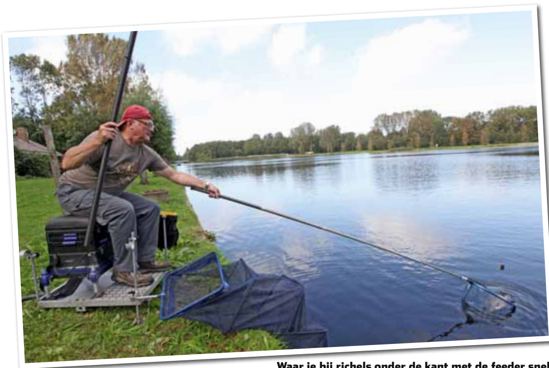
Waar je bij richels onder de kant met de feeder snel lijnbreuk krijgt, kun je er met de vaste stok veilig overheen vissen.

zonder vis – door die mossels en andere obstakels ernstig beschadigt. Met een lange vaste hengel vis je echter over de ‘rommel’ heen en kun je de vis min of meer recht boven de voerstek en weg van alle obstakels naar de oppervlakte trekken. Voor mij is dat nog steeds de voornaamste reden om met de vaste stok te ‘feederen’.