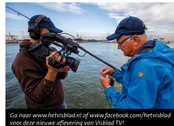
Ga naar www.hetvisblad.nl of www.facebook.com/hetvisblad voor deze nieuwe aflevering van Visblad TV!

Als mijn buurman opnieuw een tong vangt, staat ook mijn hengel te stuteren en denk ik meteen aan ook zo'n heerlijk stuk goudgeel zeebanket in roomboter. Al wat bovenwater komt is echter een armetierig botje. "Tja, die vangen we hier af en toe ook wel eens", zegt mijn leermeester die hier zelfs al geep, zeebaars en fint heeft gevangen. Wanneer vier aanbeten op rij mij echter vier botten op rij opleveren – terwijl overal om mij heen tong wordt gevangen – wordt ik toch lichtelijk wanhopig. Te meer omdat het