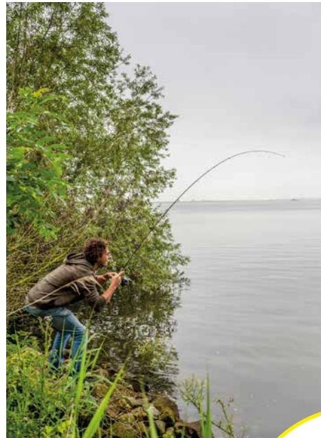
Actie aan het Haringvliet in de buurt van Middelharnis.