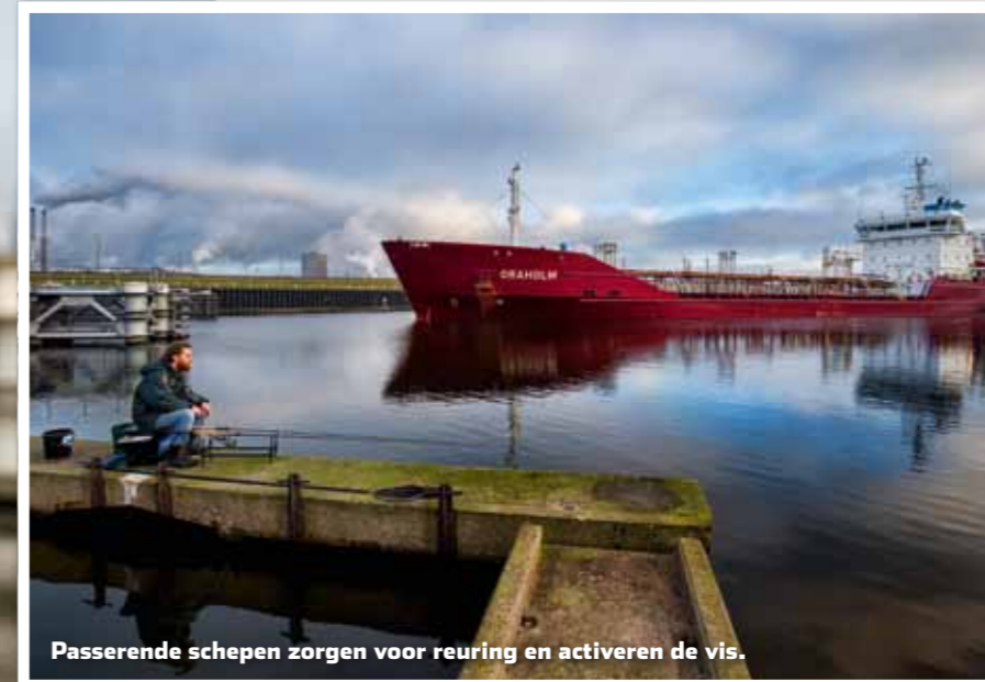
Passerende schepen zorgen voor reuring en activeren de vis.