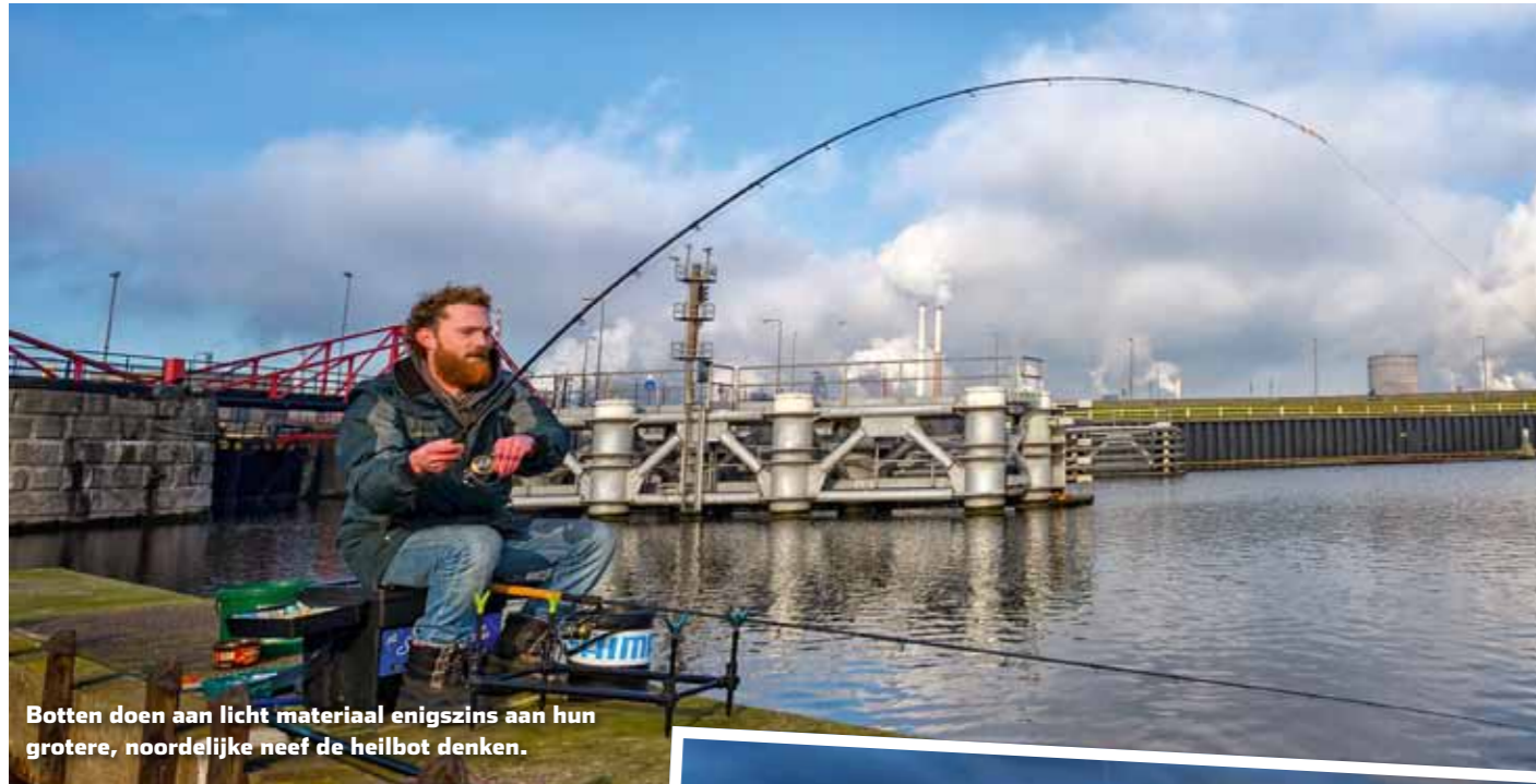
Botten doen aan licht materiaal enigszins aan hun grotere, noordelijke neef de heilbot denken.