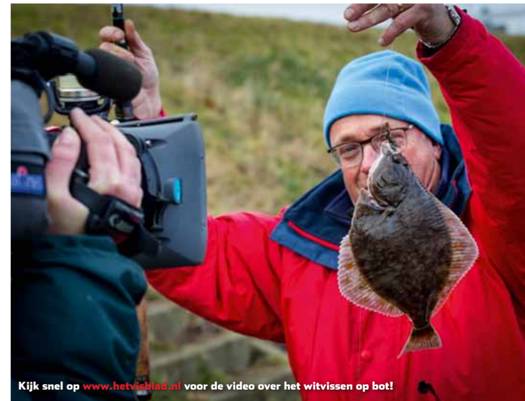
Kijk snel op www.hetvisblad.nl voor de video over het witvissen op bot!

Bot vissen kan vrijwel het hele jaar door, maar voor- en najaar en winter – mits het niet al te gek koud is – hebben Bente's voorkeur. In de zomer staat bij de visserij in het Noordzeekanaal doorgaans de tong centraal. Daarvoor wordt meestal grover materiaal ingezet om extra ver te kunnen werpen en kan het soms bijzonder druk zijn met vissers. Bot laat zich zowel overdag als 's nachts goed vangen. Bedenk wel dat als je in het donker gaat vissen je behalve de VISpas ook de bekende hologramsticker om te mogen nachtvissen op de pas moet hebben zitten. Dat is iets wat diehard zeevissers nog wel eens vergeten als ze het kanaal opzoeken en het zou zonde zijn om hiervoor op de bon te worden geslingerd. Het bovenstaande geldt uiteraard evengoed voor de kanalen in Europoort, zoals het Hartelkanaal en de Dintelhaven waar ook prima bot is te vangen. Hier gelden ook dezelfde wettelijke regels van het binnenwater, waaronder de wettelijke minimummaat van 20 centimeter voor bot.