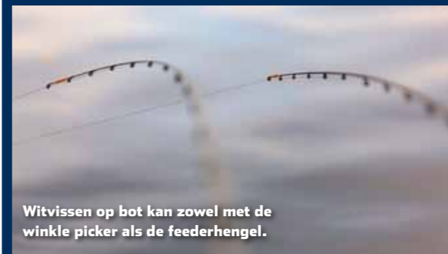
Witvissen op bot kan zowel met de winkle picker als de feederhengel.

Moet je de vis wat verder uit de kant zoeken, kies dan voor een medium heavy tot heavy feederhengel. Hierop zet je een iets groter formaat molen gevuld met gevlochten lijn en daaraan een voorslag van 35/00 of 40/00 nylon.