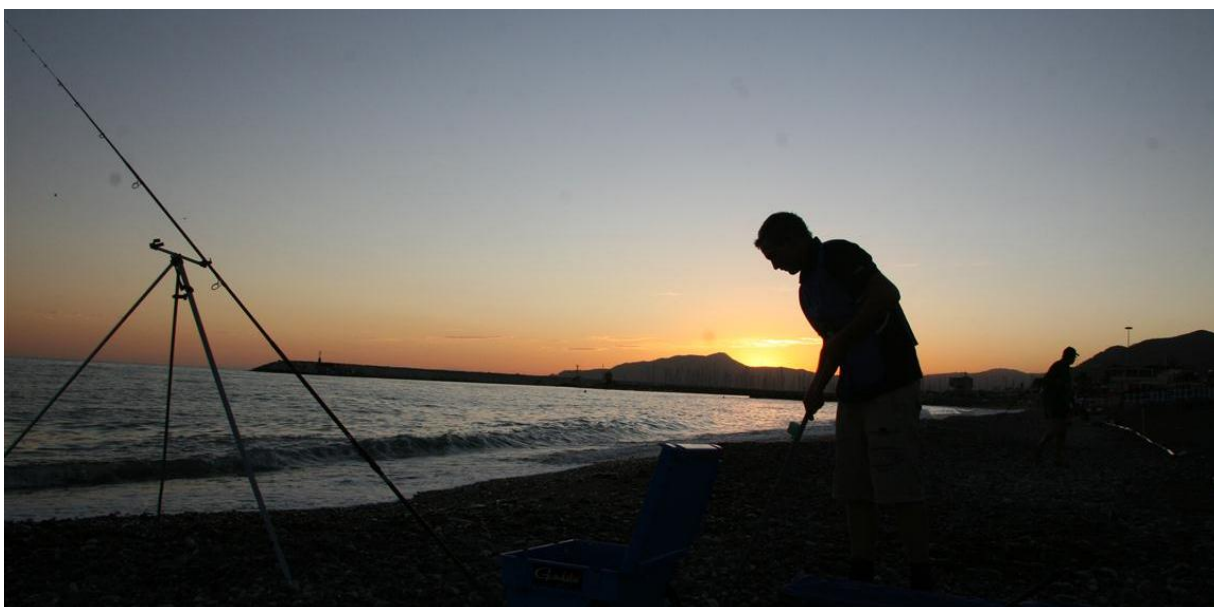
Een sfeervol plaatje