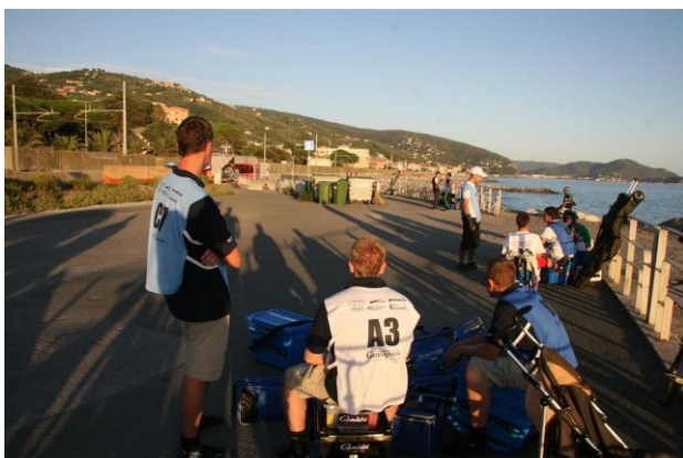
In afwachting van de organisatie

De organisatie heeft beterschap beloofd en dat het WK voor junioren morgen beter geregeld zou worden! Dus we gaan er dus vol tegenaan in de eerste tellende wedstrijd.