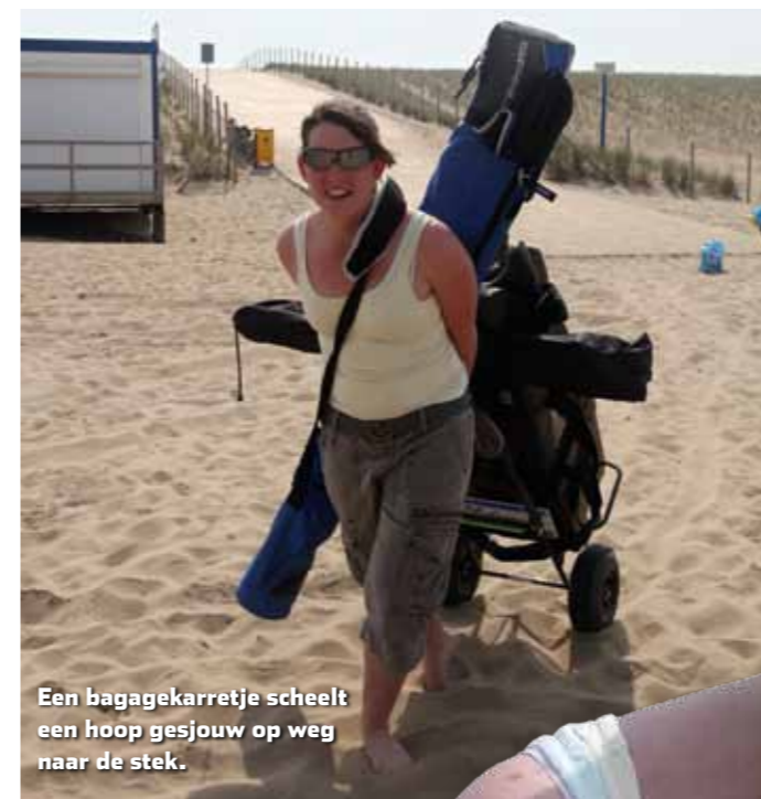
Een bagagekarretje scheelt een hoop gesjouw op weg naar de stek.

Zeevissen is zeker geen exclusieve mannenaangelegenheid.