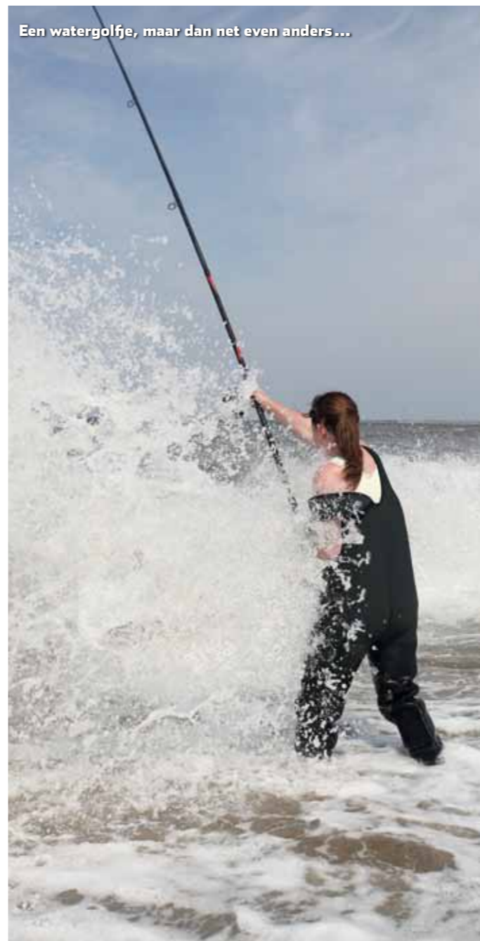
Een watergolfje, maar dan net even anders...

"Neem altijd voldoende aas mee; in ieder geval beter te veel dan te weinig. Zeepieten en zagers zijn weliswaar niet goedkoop, maar ik heb een keer meegemaakt dat ik juist op het moment dat de vis begon te bijten door mijn aas heen was. Die fout maak ik dus nooit meer. Verzorg je aas ook goed en bewaar het op een koele plek. Doe je mee aan een viswedstrijd waarbij zowel zeepieten als zagers zijn toegestaan? Neem dan van mij aan dat de combinatie van een zeepeer met een slikzager vaak de sleutel tot succes is."