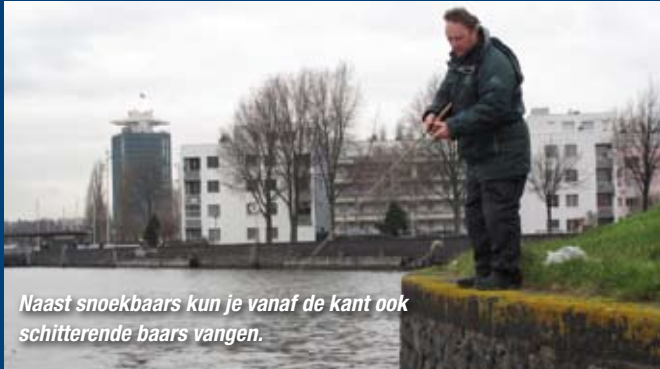
Naast snoekbaars kun je vanaf de kant ook schitterende baars vangen.

De zoete hotspot van deze maand ligt in Amsterdam Noord en is prima bereikbaar met het openbaar vervoer. Direct achter het Centraal Station ligt Het IJ, waar je het gratis pondje naar Amsterdam Noord neemt en direct op een goede baars- en snoekbaarsstek komt.