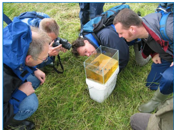
De sportvisserij doet veel aan milieu- en natuureducatie

Een waarheid als een koe! Vissen is natuurbeleving pur sang. Zonder goede visstand geen sportvisserij en zonder natuur geen mooie visstek. Sportvissers hebben verder belang bij schoon en gezond viswater en zijn tenslotte de ogen en oren aan de waterkant.