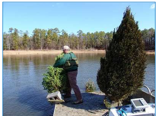
Afgezonken kerstbomen kunnen de vis prima schuilgelegenheid bieden tegen aalscholvers

In plaats van het weren van deze beschermde vogels heeft het aanbrengen van een flinke hoeveelheid beschutting voor vis vaak meer nut. Denk bijvoorbeeld aan het stimuleren van de begroeiing met waterplanten of het aanbrengen van kunstmatige structuren in het water. Sportvisserij Nederland adviseert verenigingen die last ondervinden van aalscholvers om inrichtingsmaatregelen uit te voeren, die de visstand zoveel mogelijk beschermen tegen wegvraat. Zie ook het infoblad 'Kerstbomen als schuilplaats voor vis'.