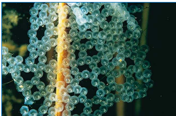
De baars paait al bij 8-14 °C

Veel vissoorten, zoals de blankvoorn, brasem en baars, zoeken in het najaar diepere plaatsen op. Omdat de temperatuur daar tamelijk constant is (ca. 4°C), kunnen ze in een toestand van rust de winter doorkomen. Er zijn echter ook vissoorten die min of meer bestand zijn tegen tijdelijke bevrozing: ze kunnen door speciale aanpassingen zelfs overleven in bevroren modder (bijvoorbeeld de zeelt).