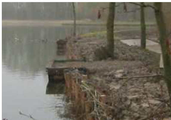
Foto: halfverharding Toepasbaarheid: bij alle voorkomende viswateren

Uitgebreidere informatie over de vergunningprocedure is beschikbaar in het infoblad "Aanleg voorzieningen: wanneer heb ik een vergunning nodig?" van Sportvisserij Nederland".