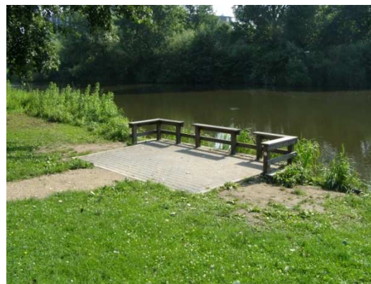
Foto: elementen verharding Toepasbaarheid: bij alle voorkomende viswateren